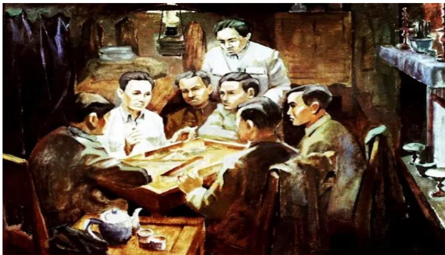
Lãnh tụ Nguyễn Ái Quốc chủ trì Hội nghị thành lập Đảng