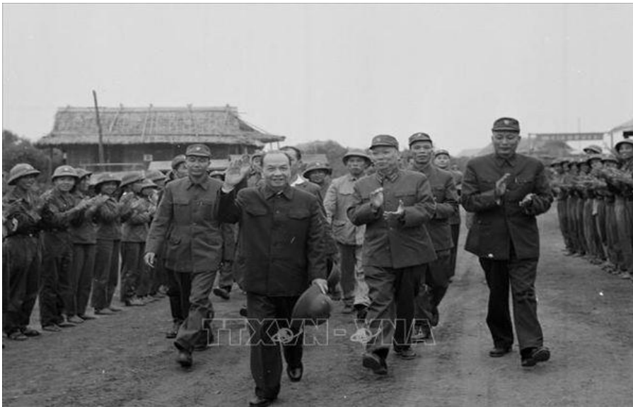
Tổng Bí thư Trường Chinh chúc Tết bộ đội Trường Sơn, Xuân Giáp Dần năm 1974

Tại Hội nghị Trung ương lần thứ 8 (năm 1941), đồng chí được cử làm Tổng Bí thư Đảng, đồng thời kiêm chủ bút các báo và tạp chí cách mạng. Đồng chí cũng là một trong những người có nhiều đóng góp quan trọng vào việc hoàn thiện quan điểm, chủ trương giành chính quyền trong cách mạng dân tộc dân chủ nhân dân. Cách mạng Tháng Tám thành công, đồng chí được cử và giữ nhiều chức vụ quan trọng của Đảng, Nhà nước như: Ủy viên Ban Chấp hành Trung ương, Ủy viên Bộ Chính trị, Tổng Bí Thư, Chủ tịch Ủy ban Thường vụ Quốc hội. Dù ở cương vị nào, đồng chí luôn thể hiện rõ là một nhân cách lớn, một nhà lãnh đạo chiến lược tầm vóc, một nhà tổ chức xuất chúng và nhà lý luận cách mạng kiệt xuất.