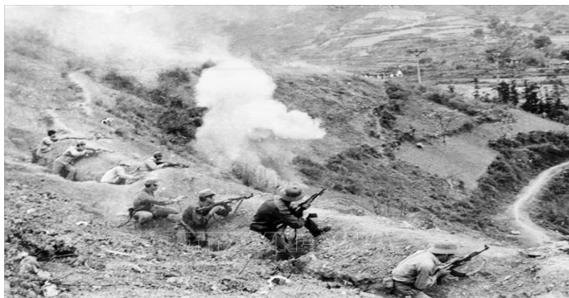
Lực lượng công an vũ trang dũng cảm chiến đấu tại khu vực Đồng Đăng, tỉnh Lạng Sơn

Ngày 17/02 cách đây 46 năm, quân và dân cả nước ta đương đầu với cuộc chiến tranh xâm lược trên toàn tuyến biên giới phía Bắc. Nhìn lại cuộc chiến đấu bảo vệ biên giới phía Bắc để thêm một lần nữa khẳng định sự thật lịch sử và tính chính nghĩa của dân tộc Việt Nam, sẵn sàng “Quyết tử cho Tổ quốc quyết sinh” để bảo vệ từng tấc đất thiêng liêng của Tổ quốc, vì độc lập, tự do và khát vọng hòa bình.