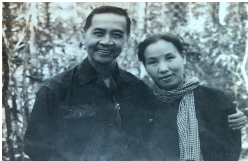
Đồng chí Huỳnh Tấn Phát và vợ trong kháng chiến chống Mỹ

Cuộc đời hoạt động cách mạng của ông Huỳnh Tấn Phát gắn liền với sự nghiệp đại đoàn kết dân tộc và có những cống hiến to lớn trong sự nghiệp cao cả này. Được Đảng, Nhà nước giao phó nhiều vị trí quan trọng khác nhau, dù ở cương vị nào, ông cũng đem hết công sức, trí tuệ, tâm huyết để cống hiến cho lợi ích chung của dân tộc, của nhân dân. Với tài và những phẩm chất tốt đẹp, ông đã để lại những tình cảm, ấn tượng đặc biệt trong lòng bạn bè, đồng chí, đồng đội.